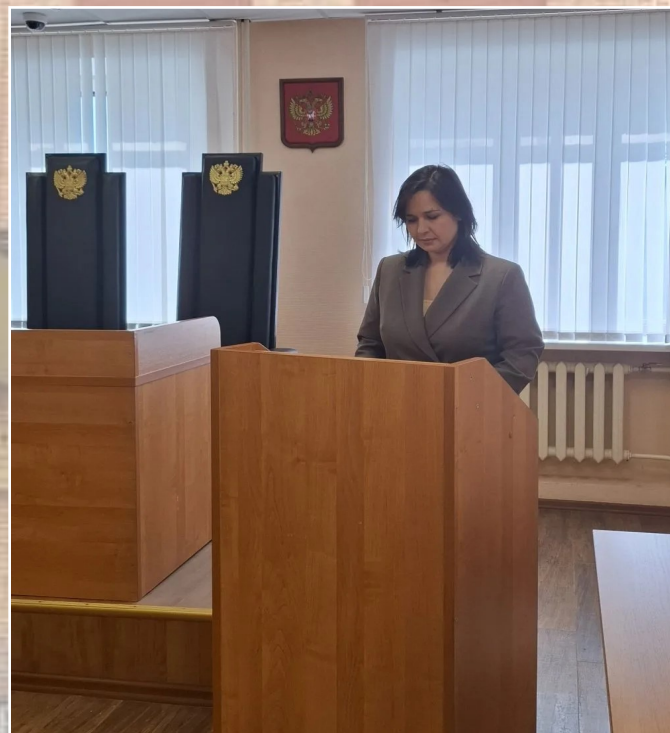
Пресс-служба Альметьевского городского суда РТ

На церемонии присутствовали судьи и работники аппарата городского суда. В адрес нового судьи прозвучали поздравления, напутственные слова и пожелания успешной деятельности.