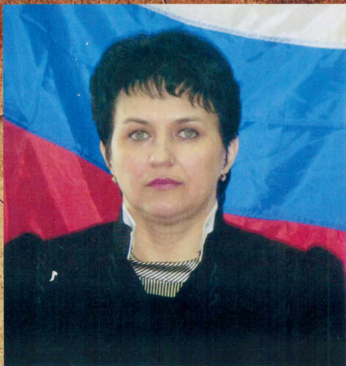
Коваленко Римма Константиновна, и.о. председателя Бурлинского районного суда с 2004 г. с 2008 г. по 2014 г. председатель суда, в настоящее время судья Бурлинского районного суда