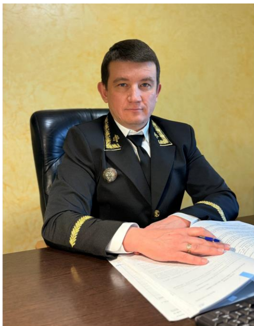
Судья Херсонского областного суда Суходолов А.С.