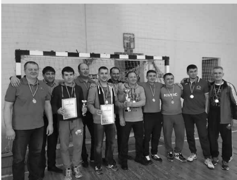
Команда судей по мини-футболу

Участие сотрудников Новошешминского районного суда и судебного участка №1 по Новошешминскому судебному району в различных спортивных состязаниях как в районе, так и на республиканском уровне становится традиционным.