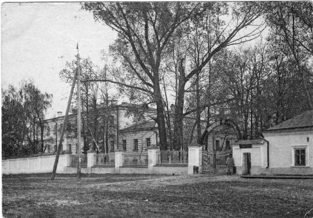
Здание Восточно-педагогического института, где проходил процесс над шакуровцами (ныне Суворовское училище).