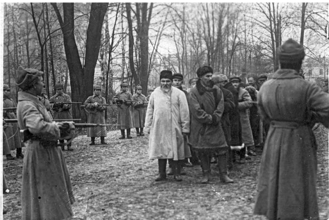
Шакуровская банда после оглашения расстрельного приговора