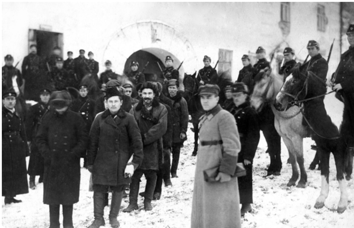
Шакуровскую банду конвоируют в суд из Пердомзак (Кремль)

Окончание. Начало в № 10-11 от 15 мая 2017 года