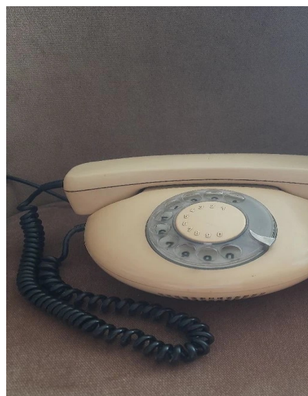
Дисковый телефонный аппарат