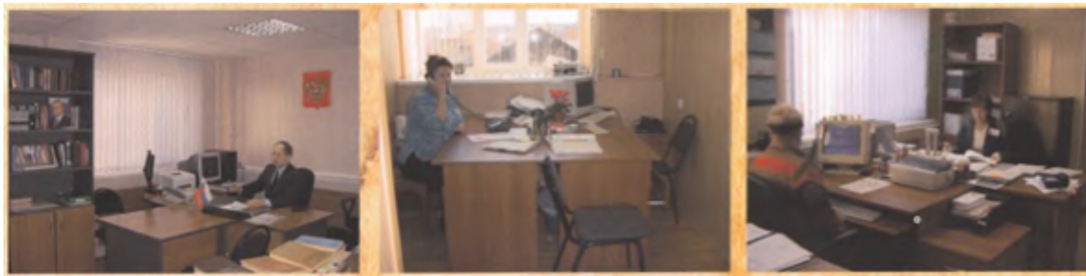
Кабинет председателя суда