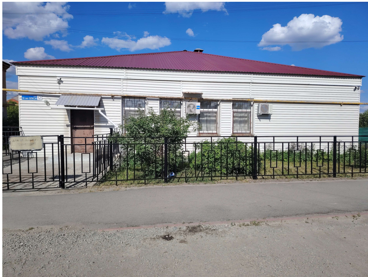
Входная группа здания Увельского районного суда