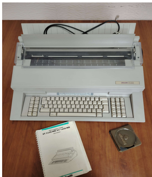
Печатная машинка Оливетти