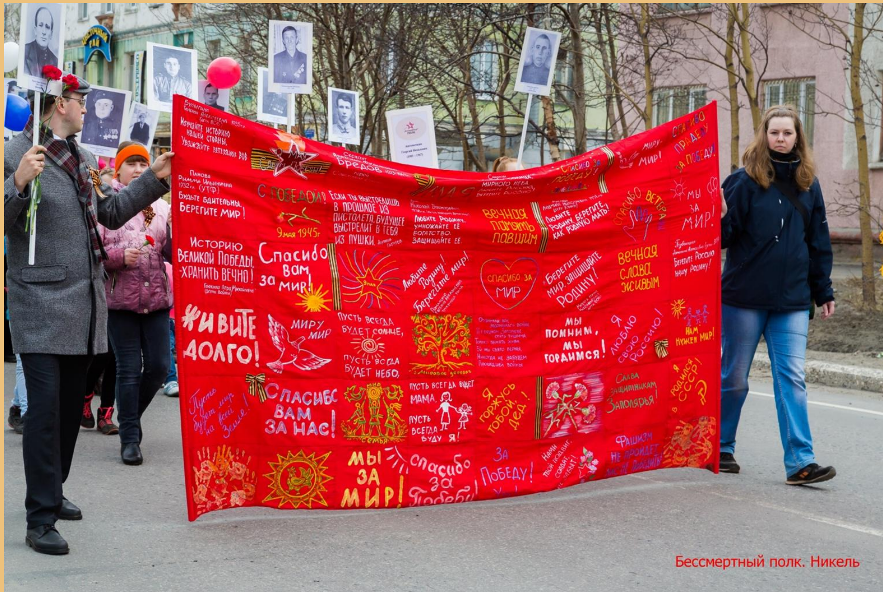
Бессмертный полк. Никель