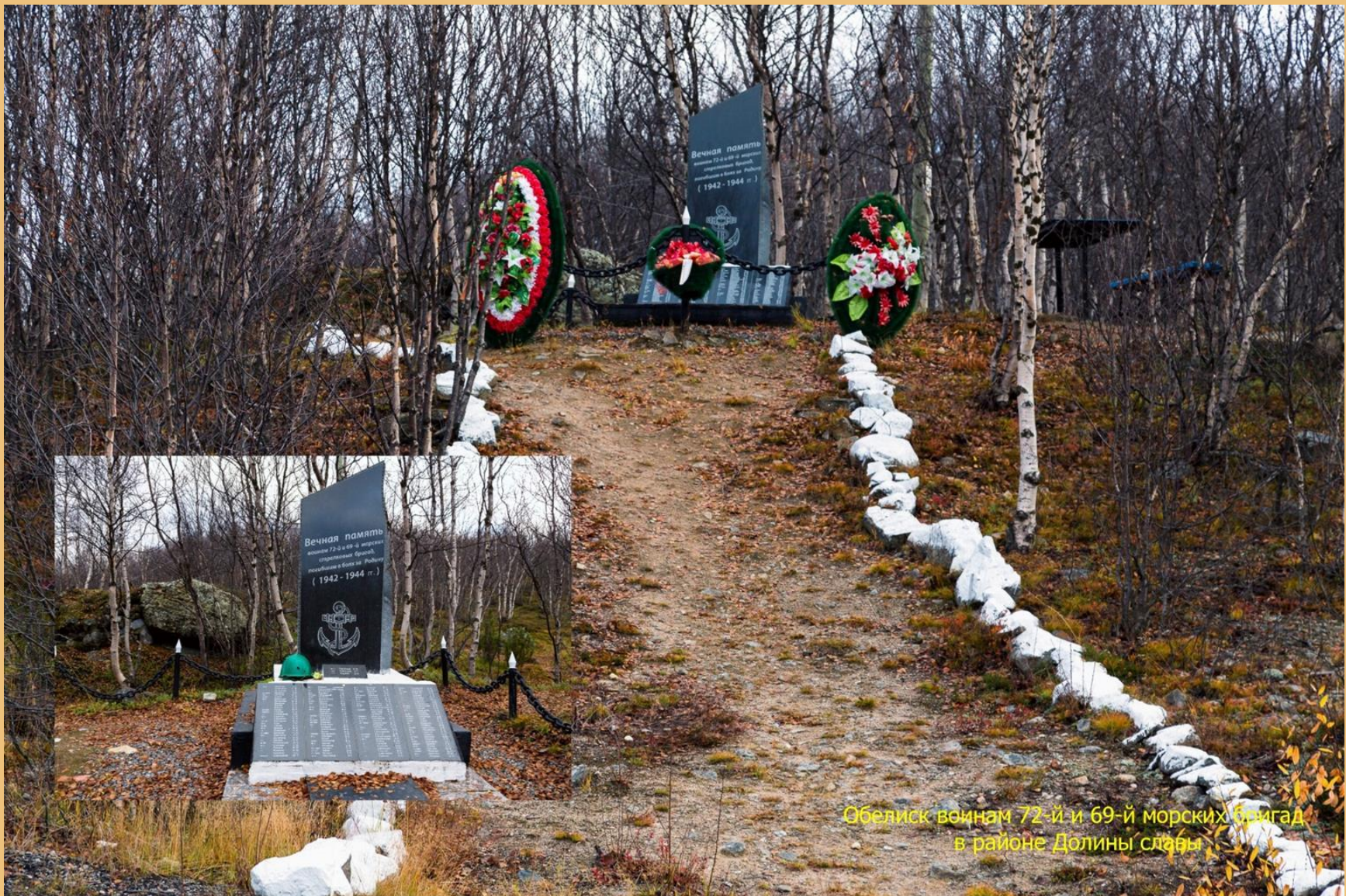
Обелиск воинам 72-й и 69-й морских бригад в районе Долины славы