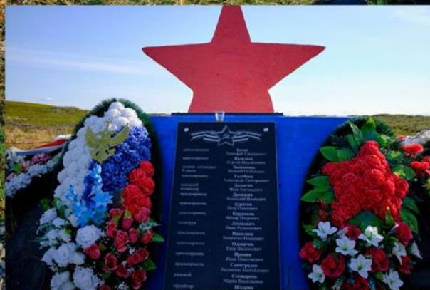
Воинские захоронения на полуострове Рыбачий