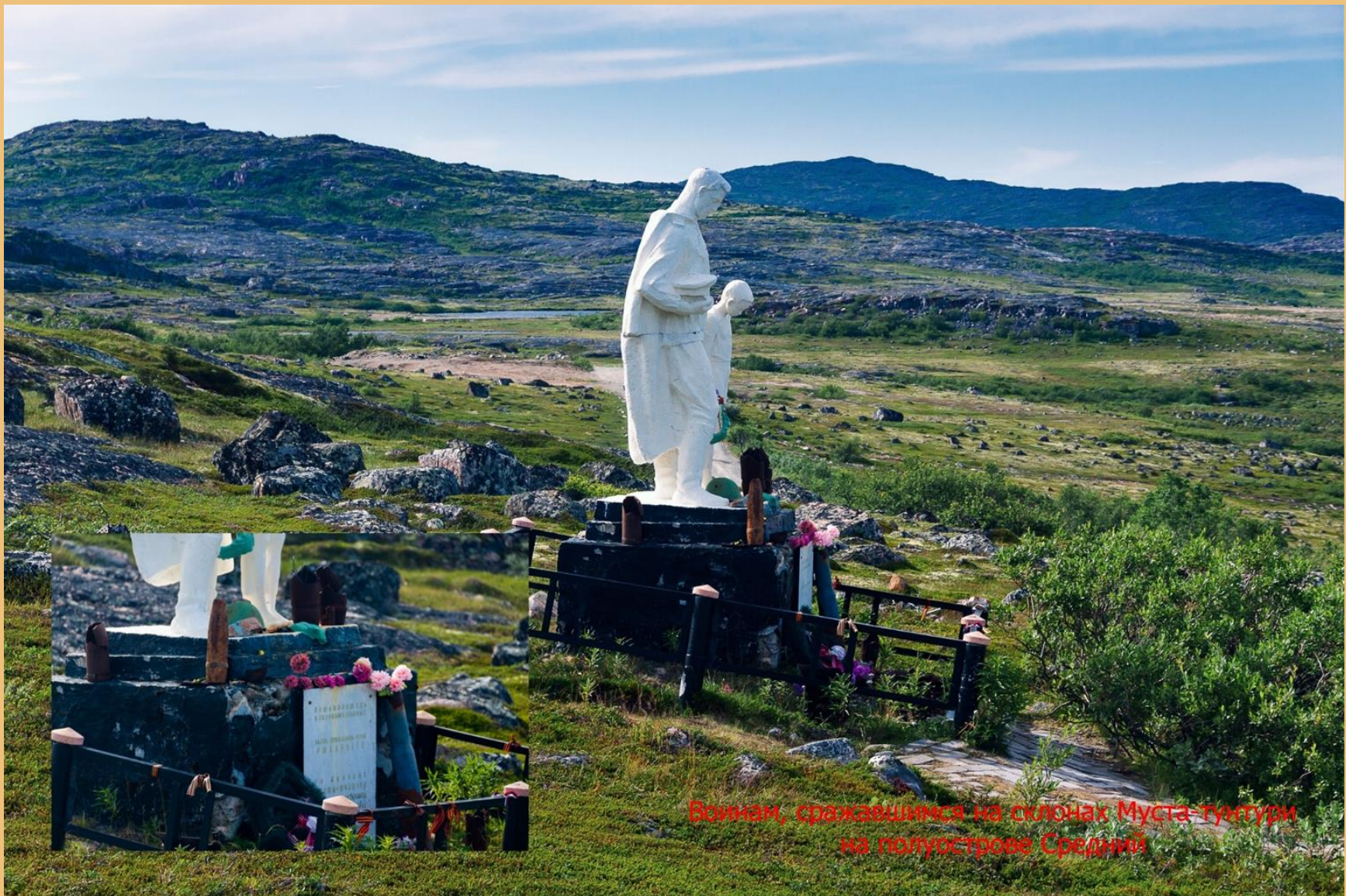
Воинан, сражавшимся на склонах Муста-тунтури на полуострове Средний