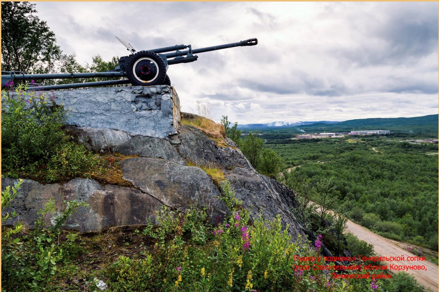
Пушка у подножья Генеральской сопки (гора Спасительная) vicino Корзуново, Печенгинский район