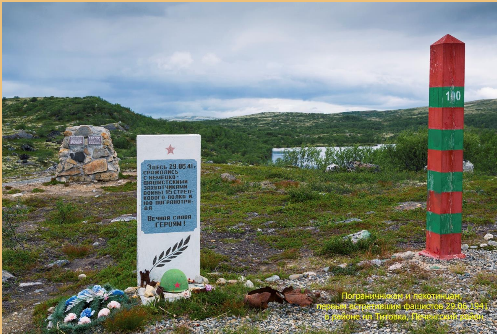
Пограничникам и пехотинцам, первым встретившим фашистов 29.06.1941 в районе нп Титовка, Печенгский район