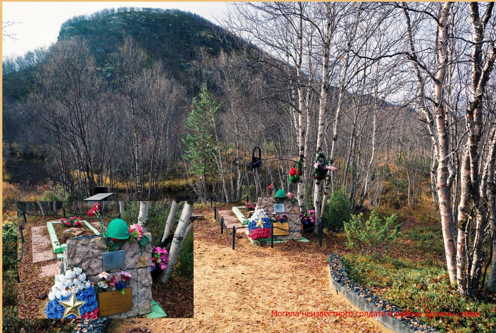
Могилы неизвестного солдата в районе Долины славы