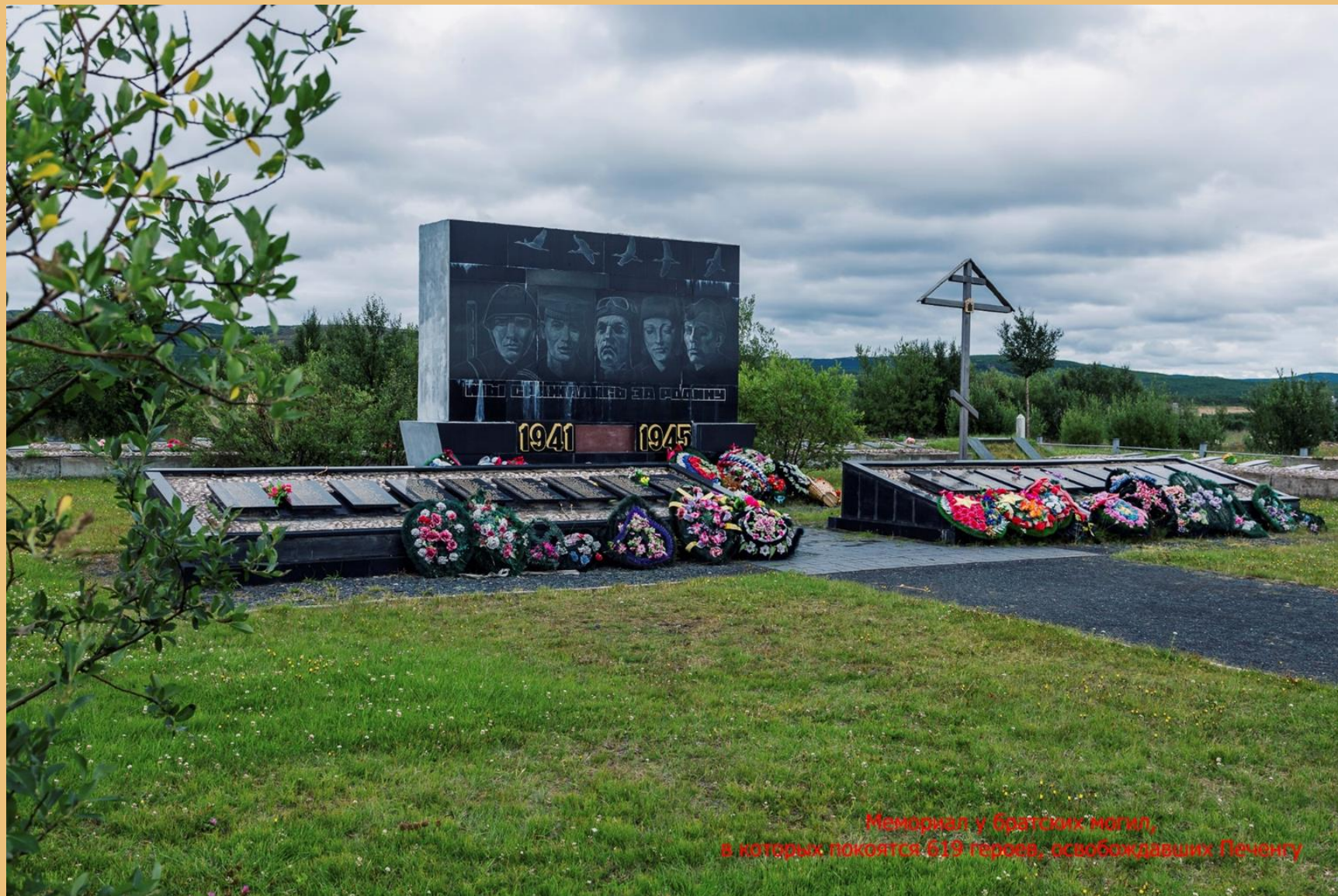
Мемориал у братских могил, в которых покоятся 619 героев, освобождавших Печенгу