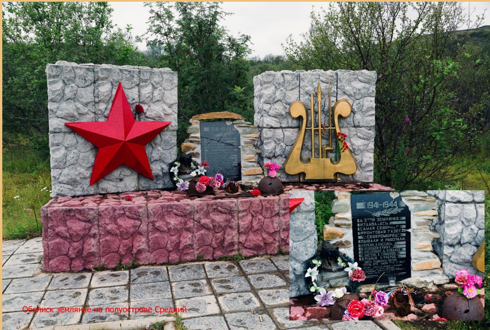
Обелиск землянке на полуострове Средний