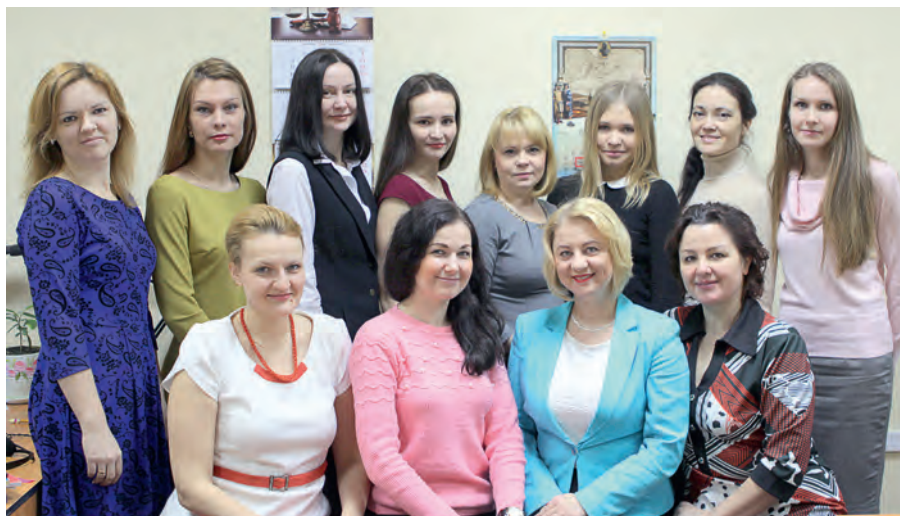
С коллегами - работниками аппарата Арбитражного суда Архангельской области, 2017 год