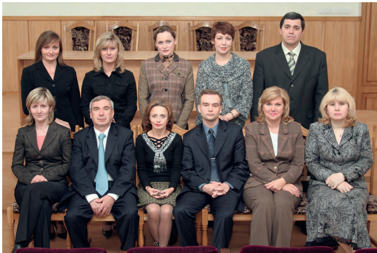
Судьи Октябрьского районного суда города Архангельска, 2007 год