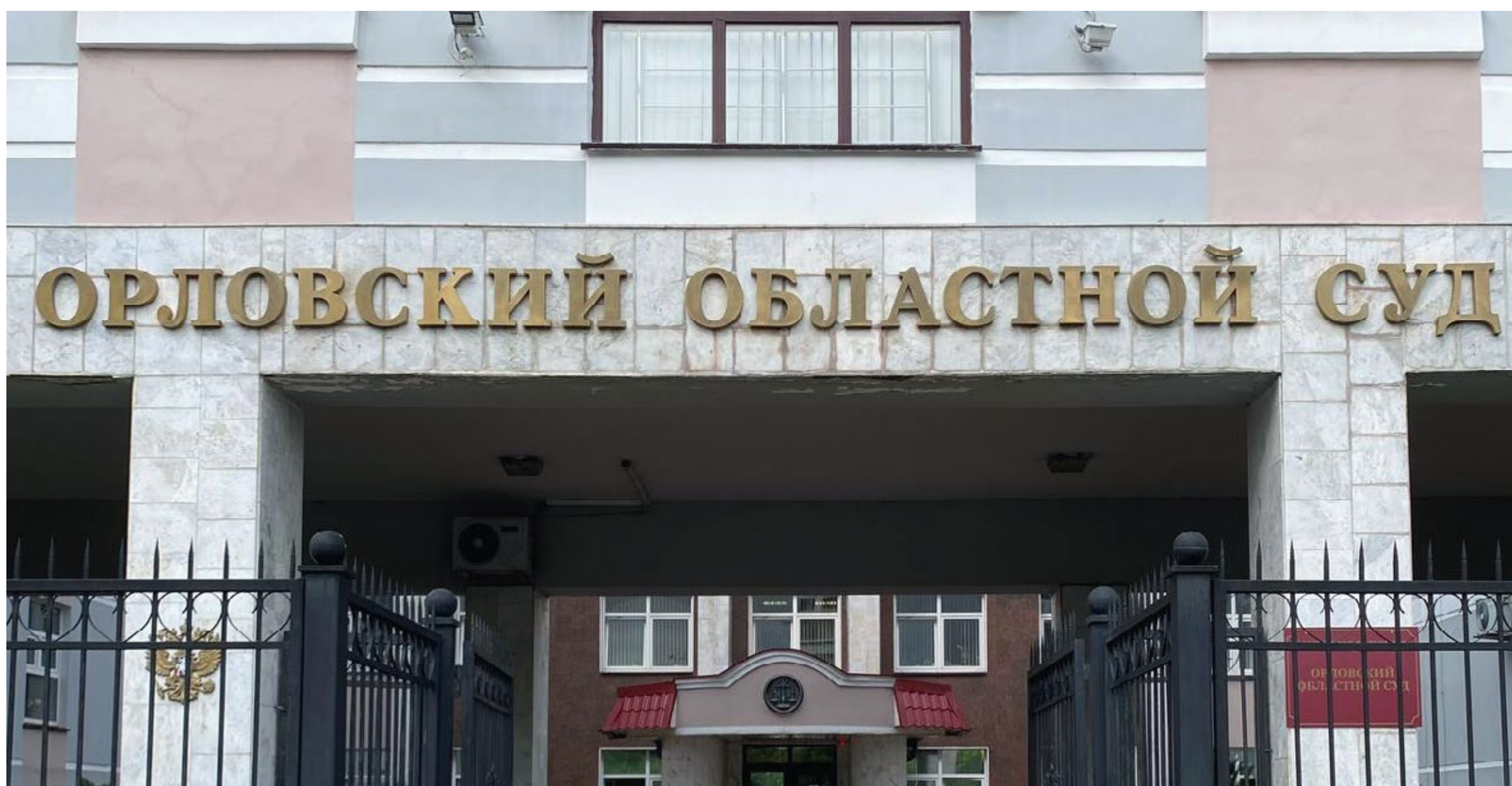
Здание Орловского областного суда