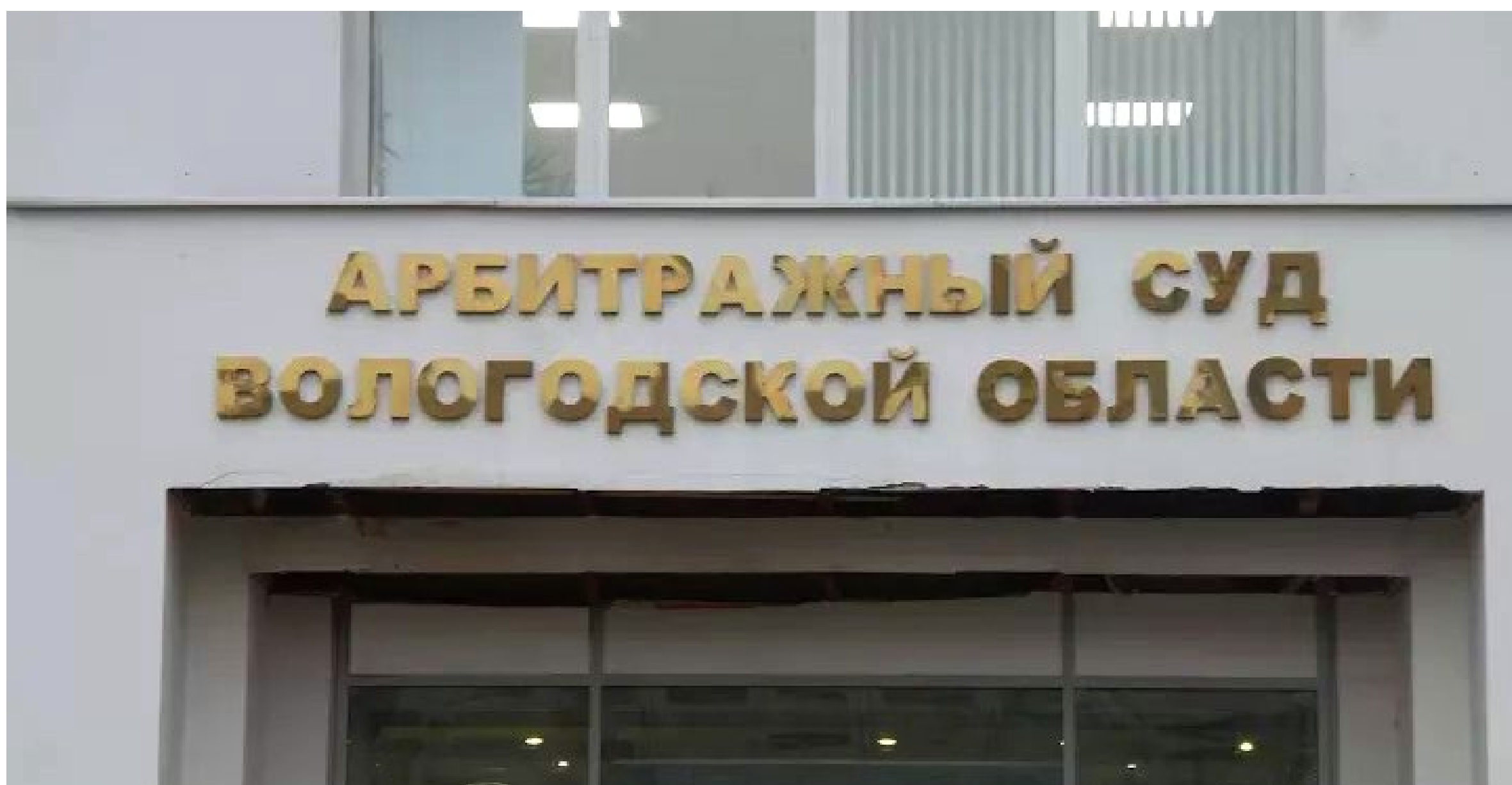
Здание Арбитражного суда Вологодской области.