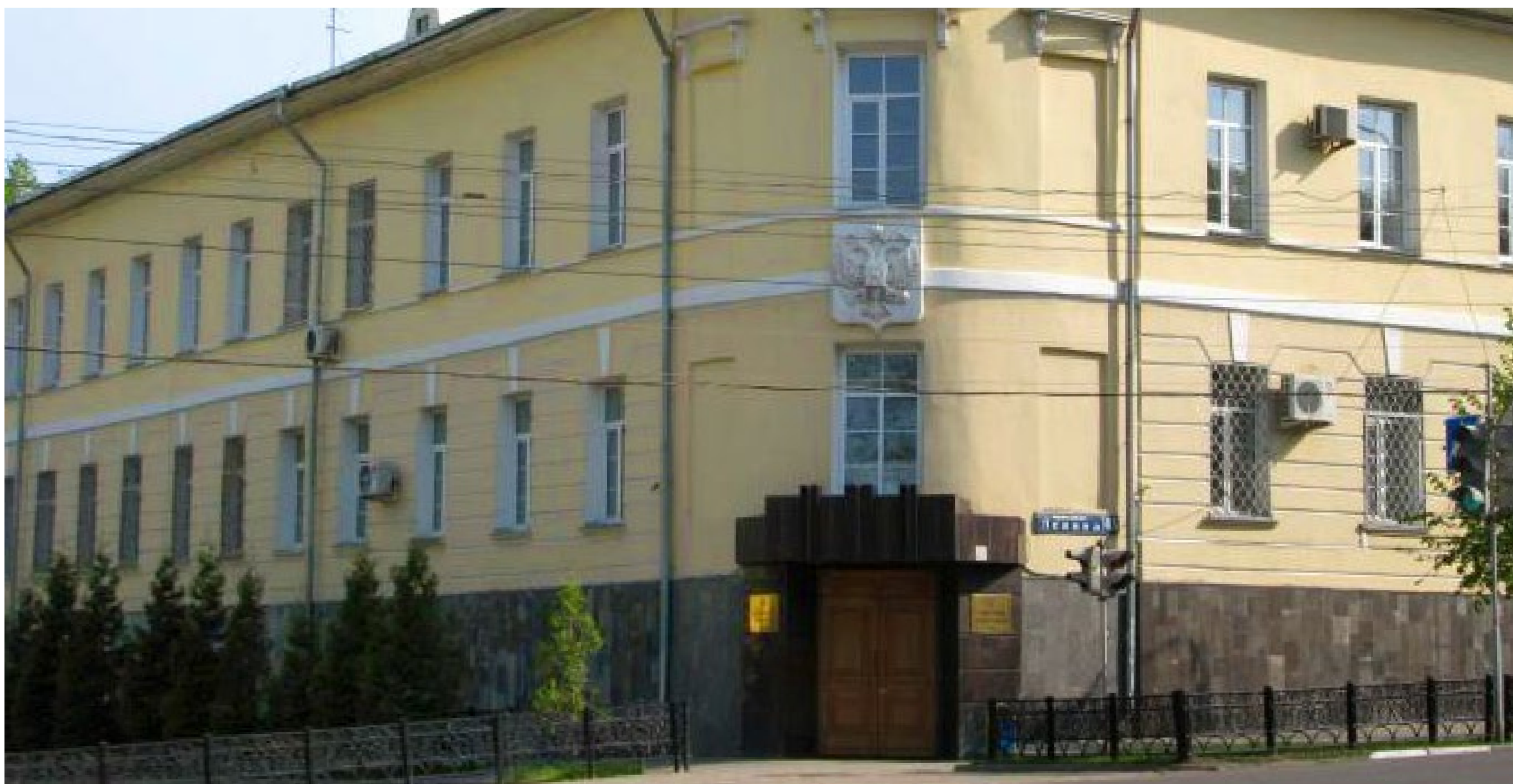
Здание Тульского областного суда.