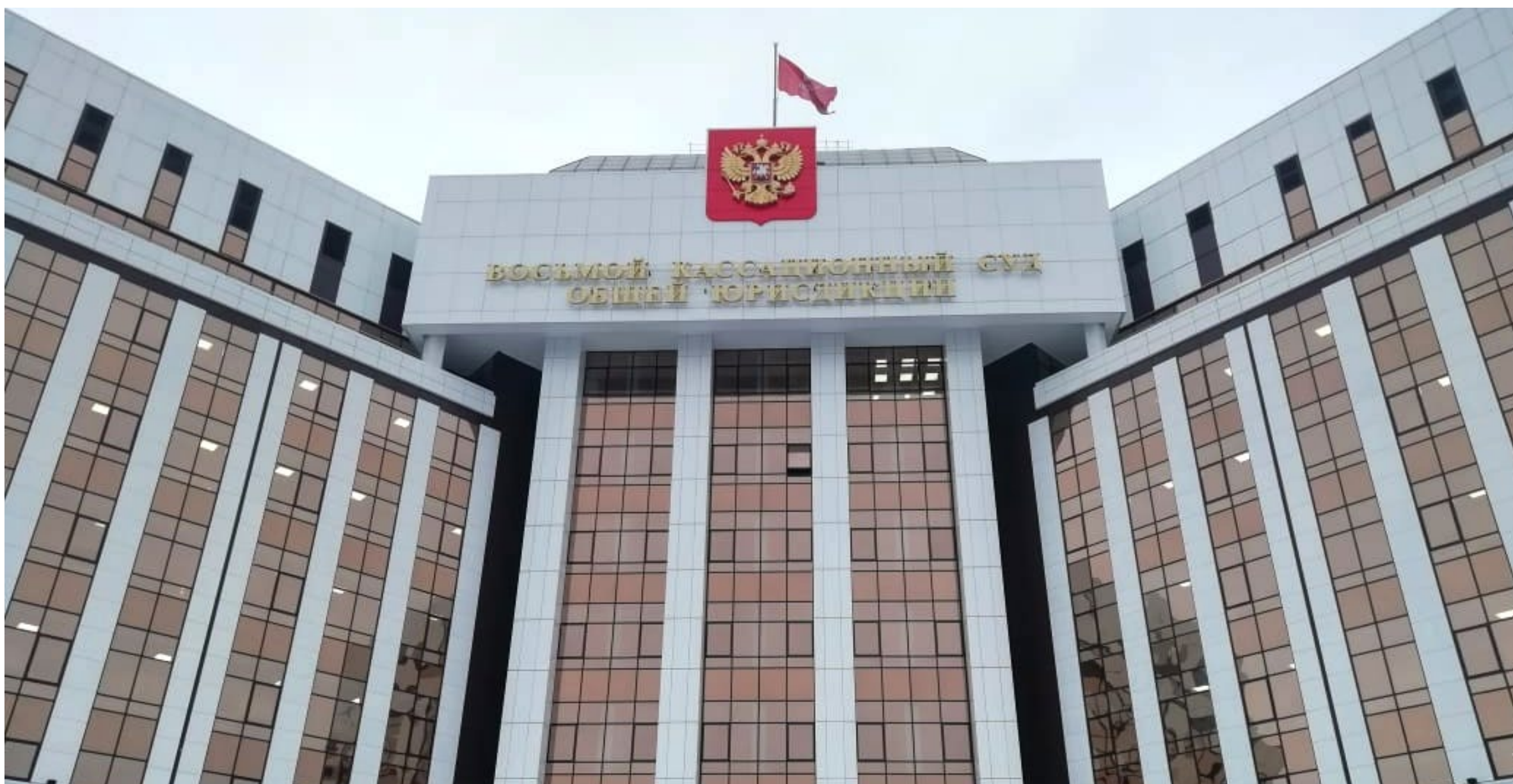
Здание Восьмого кассационного суда общей юрисдикции.