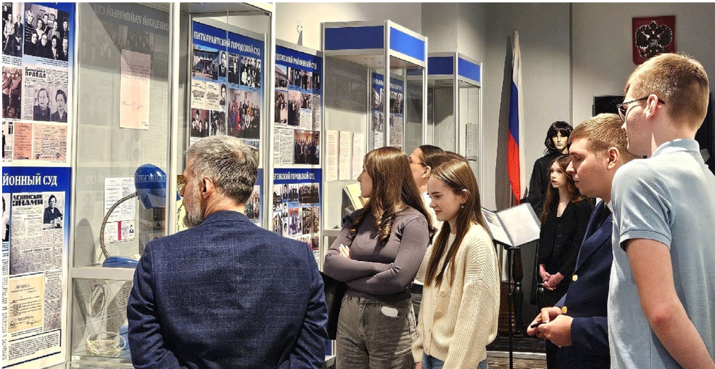
Институт экономики и права | ПетрГУ.