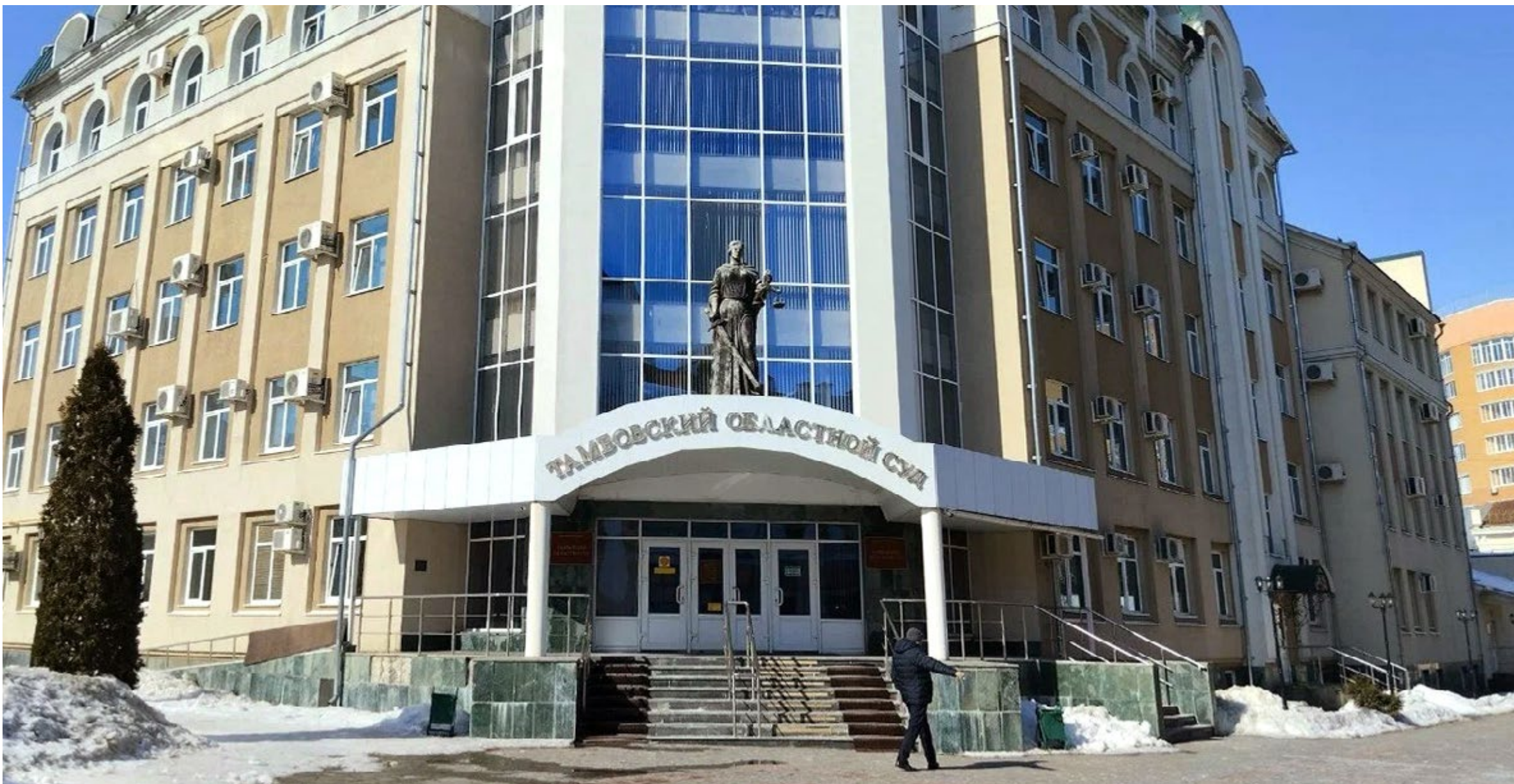
Здание Тамбовского областного суда.