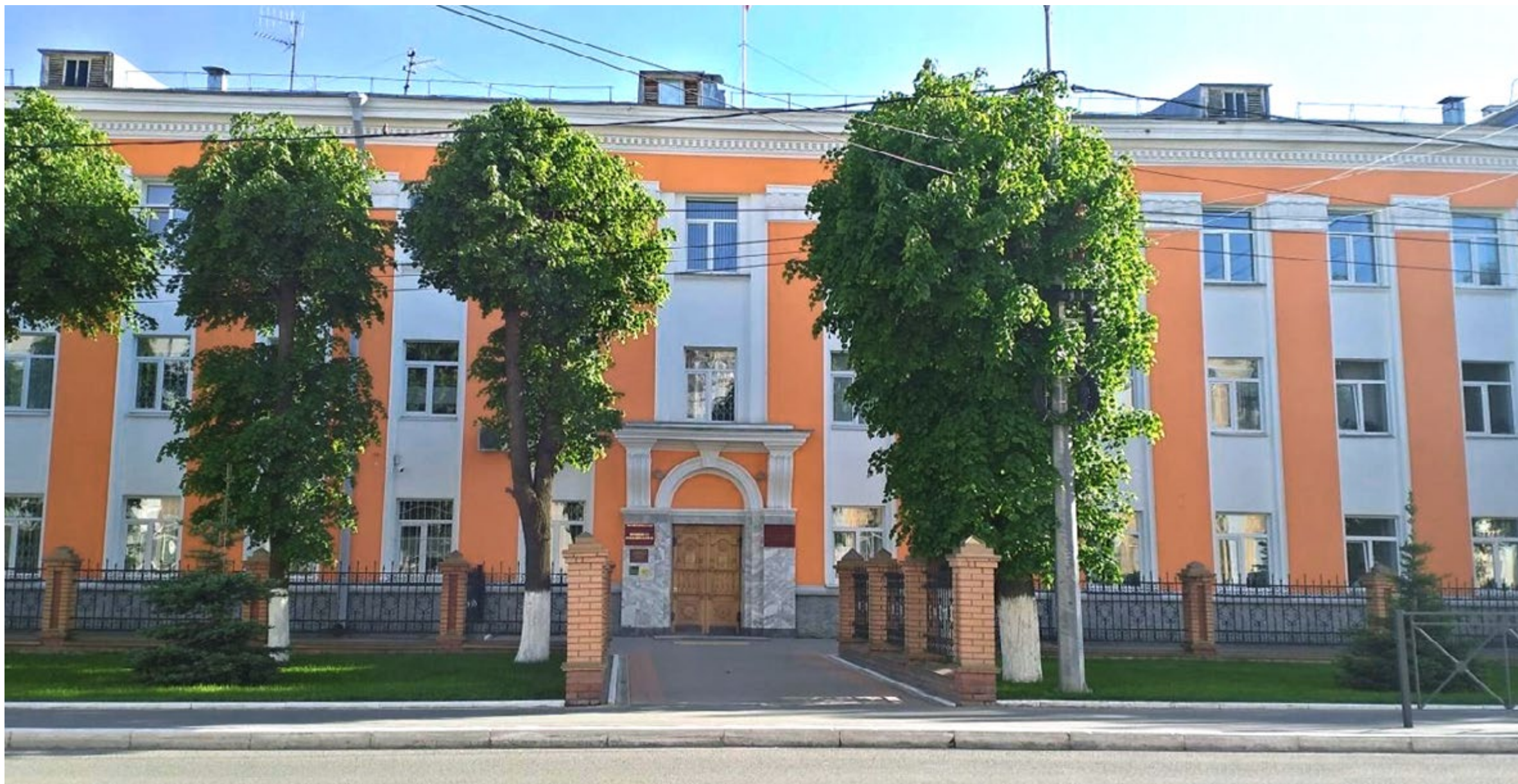
Здание Верховного Суда Республики Марий Эл.