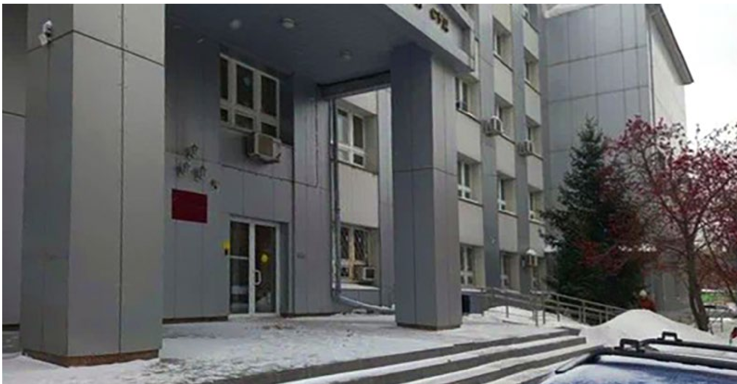
Новосибирский областной суд