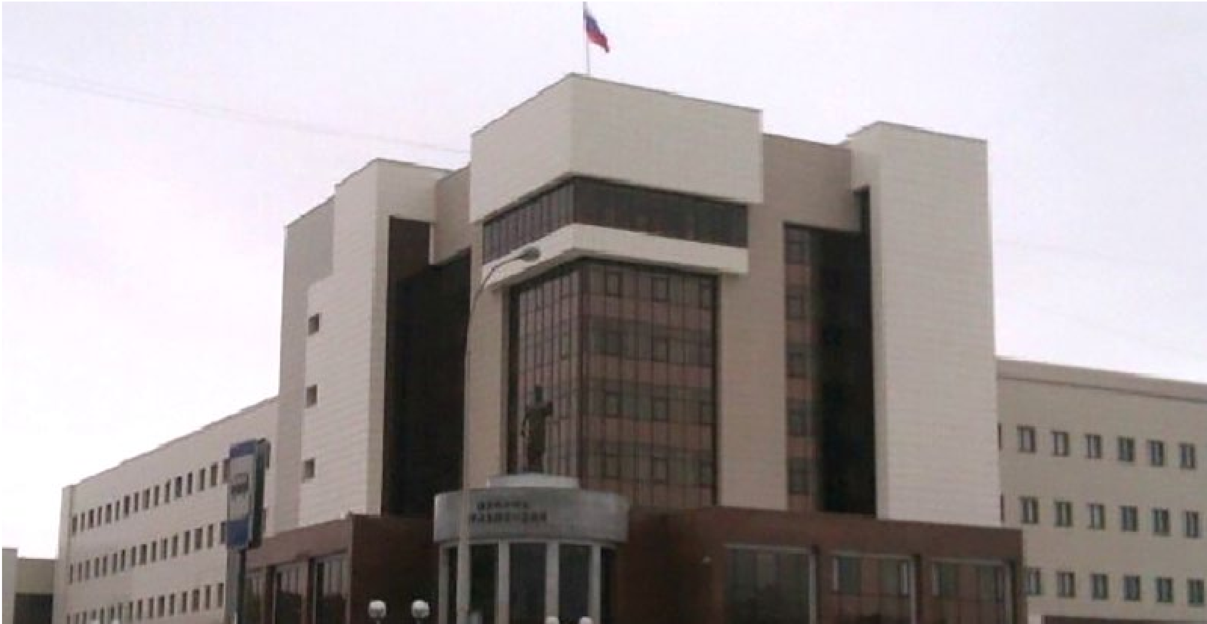
Здание Свердловского областного суда.