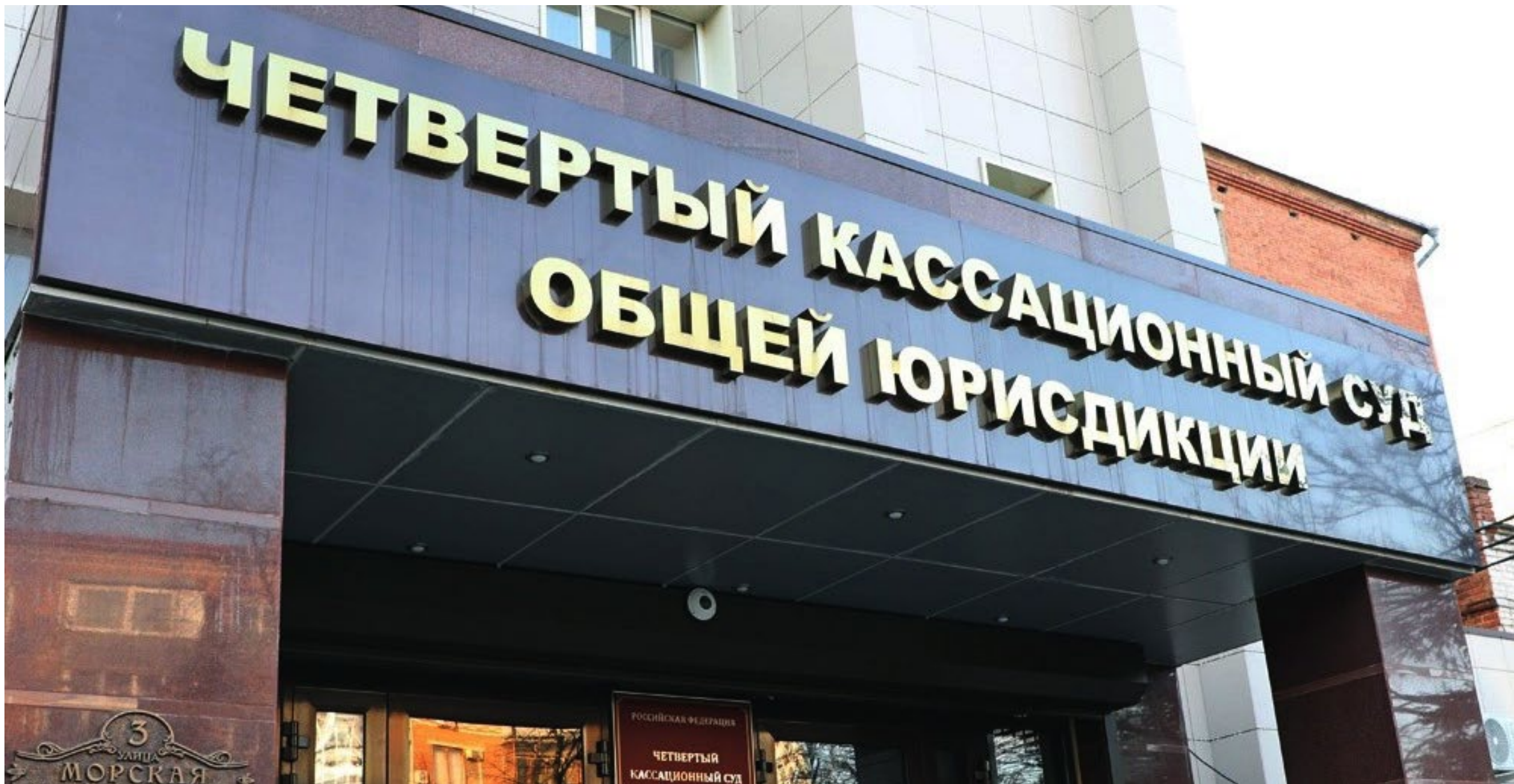
Здание Четвертого кассационного суда общей юрисдикции.