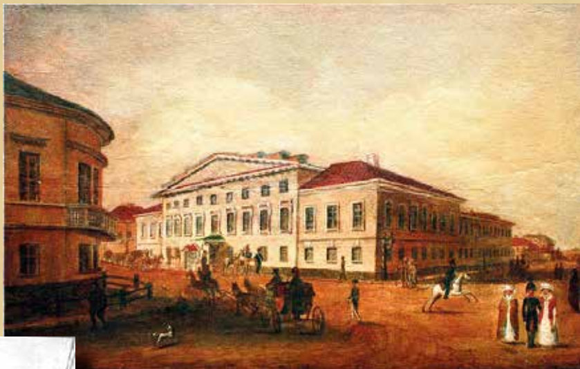
В.С. Турин Дом военного губернатора Казани, 1820-е годы. В этом здании в 1870 году разместилось главное присутствие Казанского окружного суда

Казанский окружной суд – Верховный Суд Республики Татарстан