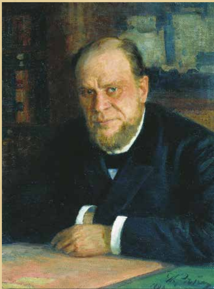
А.Ф. Кони – один из первых прокуроров Казанского окружного суда. Он занимал эту должность с 1870 по 1871 год.