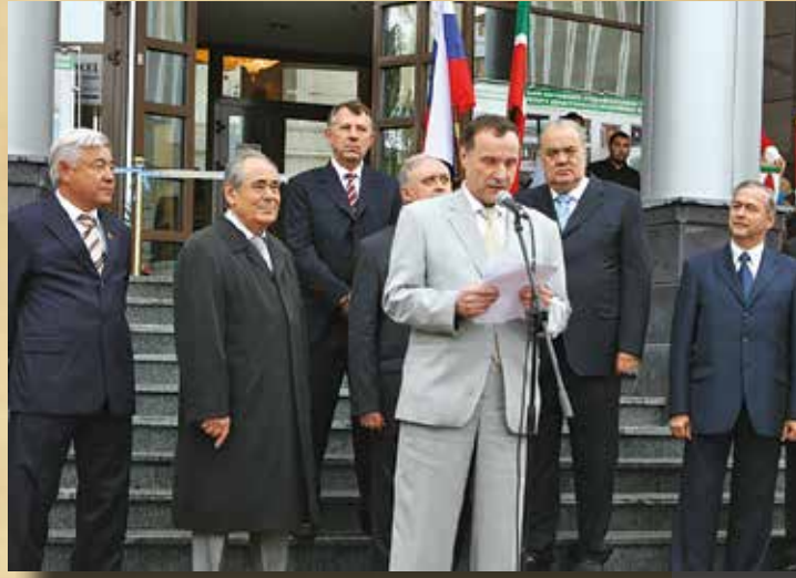
Открытие нового здания Верховного Суда РТ, 2009 год