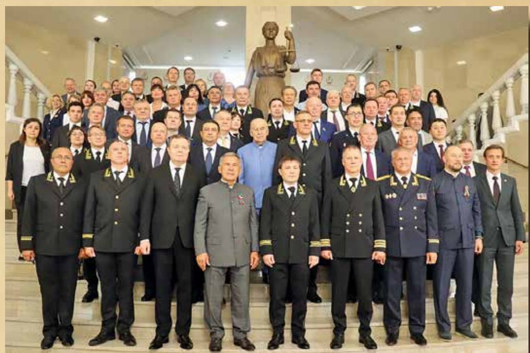
Церемония представления Председателя Верховного Суда РТ А.М. Гильмутдинова, 29 августа 2024 года

• 8 ноября 1870 года состоялось торжественное открытие Казанского окружного суда