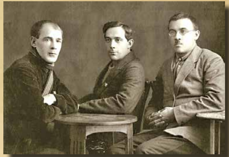
Президиум Главного суда ТАССР, середина 1920-х годов