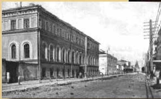
Казанский окружной суд. Конец XIX – начало XX века