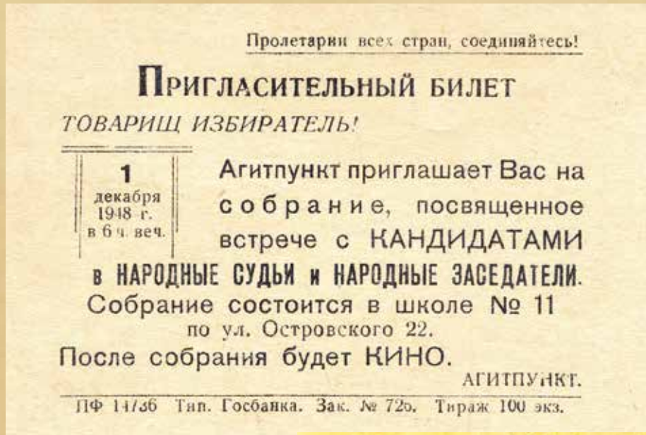
Первые послевоенные выборы народных судей состоялись 19 декабря 1948 года