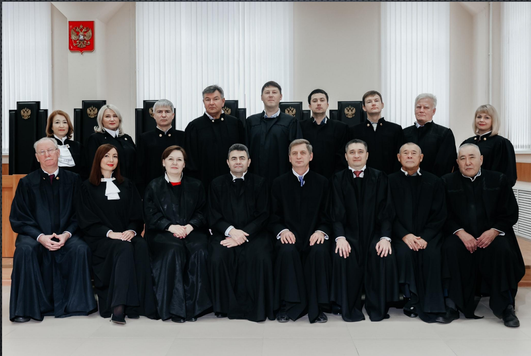
Судьи Орджоникидзевского районного суда г. Уфы