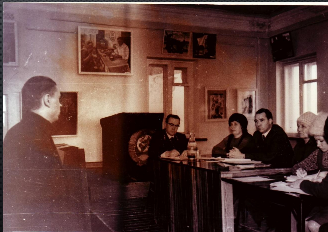
Показательный судебный процесс Апрель 1975 года