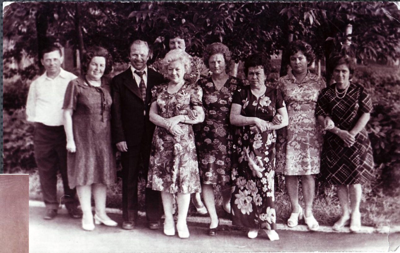
Судьи Орджоникидзевского районного суда г. Уфы в разные годы деятельности