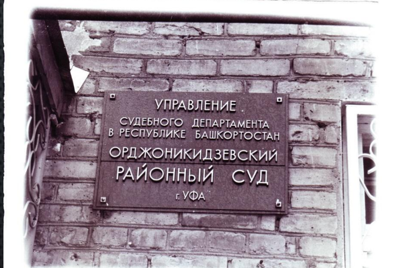
ИСТОРИЧЕСКОЕ ЗДАНИЕ ОРДЖОНИКИДЗЕВСКОГО РАЙОННОГО СУДА Г. УФЫ НА УЛИЦЕ КОРОЛЕНКО, 7А