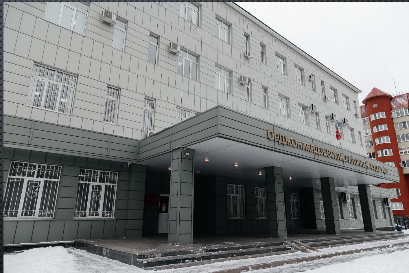
СОВРЕМЕННОЕ ЗДАНИЕ ОРДЖОНИКИДЗЕВСКОГО РАЙОННОГО СУДА Г. УФЫ НА УЛИЦЕ УЛЬЯНОВЫХ, 51