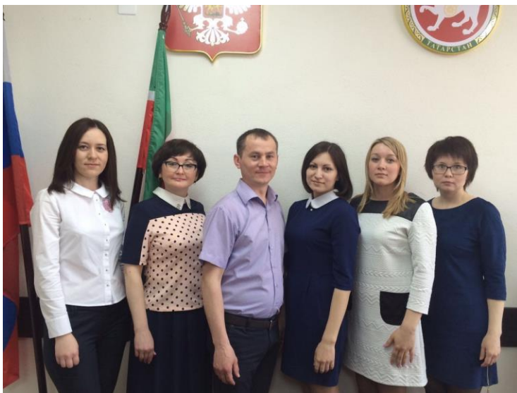
Сотрудники аппарата мировых судей

заведующими канцелярией в разные годы. Их ответственное отношение к порученному участку работы, безупречное исполнение должностных обязанностей позволили им добиться хороших показателей в работе. Они также награждены Благодарственным письмом Министра юстиции Республики Татарстан.