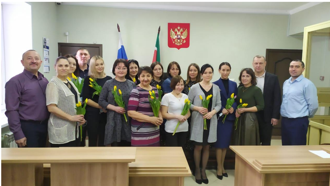
Коллективы районного суда и мировых судей (март 2022 года)