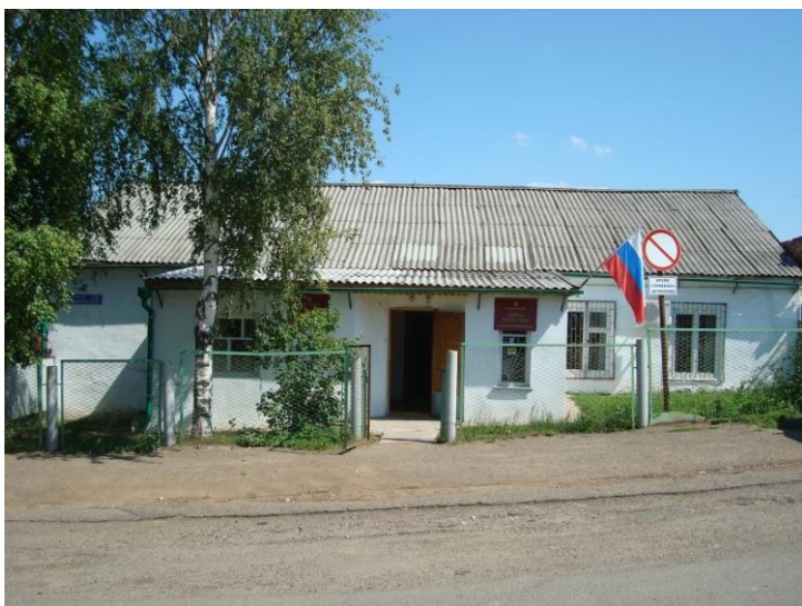
Здание районного суда расположенное на ул. Советская с. Балтаси