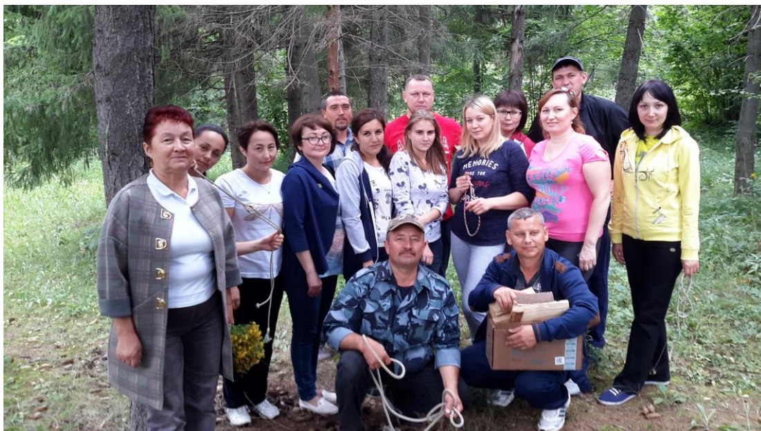
Коллективы районного суда и мировых судей при сдаче норм ГТО (август 2017 года)

Коллективы Балтасинского районного суда и мировых судей по Балтасинскому судебному району работают дружно, сплоченно. Сотрудники аппаратов обладают огромным опытом и знаниями в вопросах организации и ведения делопроизводства, качественно и оперативно исполняют свои должностные обязанности.