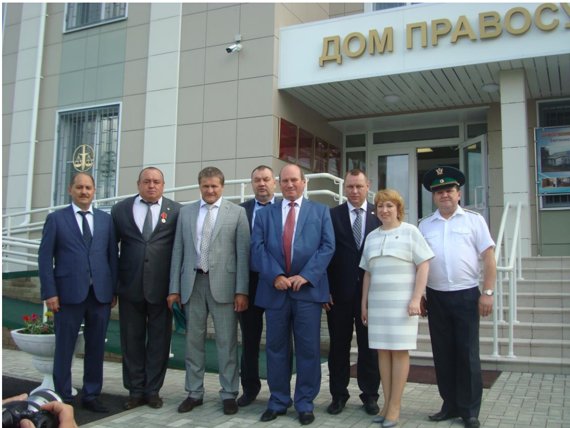
Открытие нового здания Балтасинского районного суда РТ июнь 2015 года