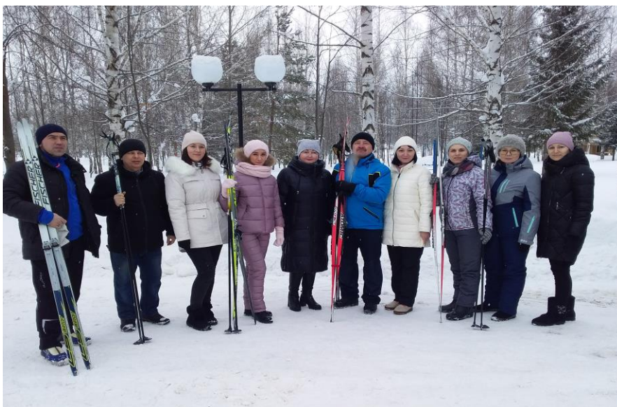
Коллективы районного суда и мировых судей на массовом лыжном забеге «Лыжня России 2022» (февраль 2022 года)