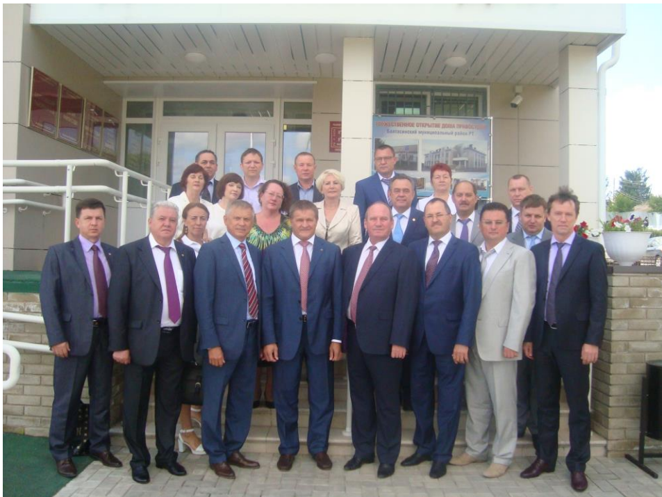
Открытие нового здания Балтасинского районного суда РТ июнь 2015 года