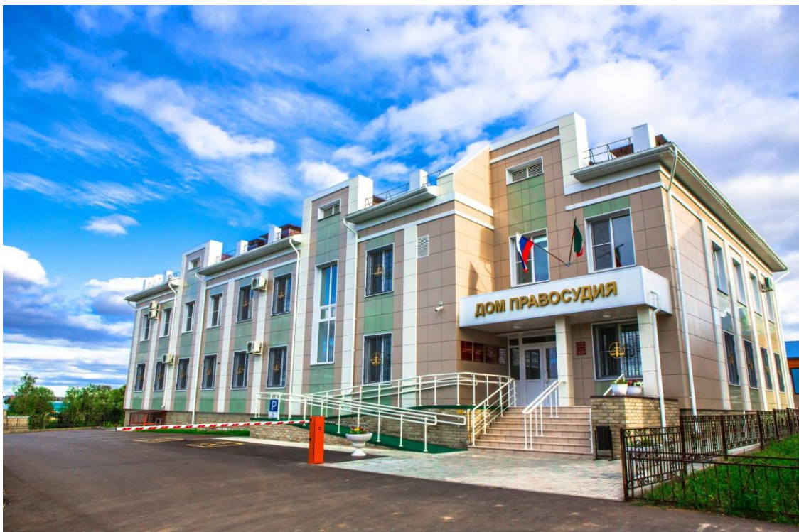
Новое здание Балтасинского районного суда Республики Татарстан