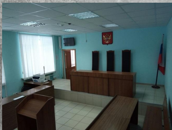
Зал судебного заседания №1 (1 этаж) 2018 г.