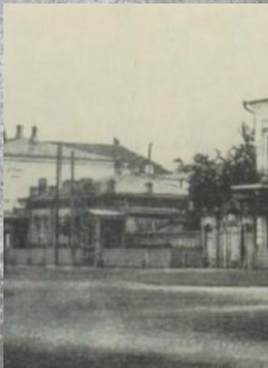
здание на площади Советов в г. Мелекесе, в котором располагались городской и районный народные суды до 1946 г.

История Мелекесского районного суда берет свое начало с 1928 года, когда в Ульяновском округе начала действовать сеть судебных учреждений.