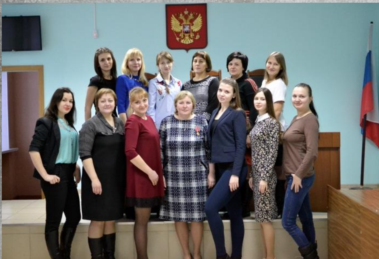
аппарат Мелекесского районного суда (г. Димитровград) 2018 г.