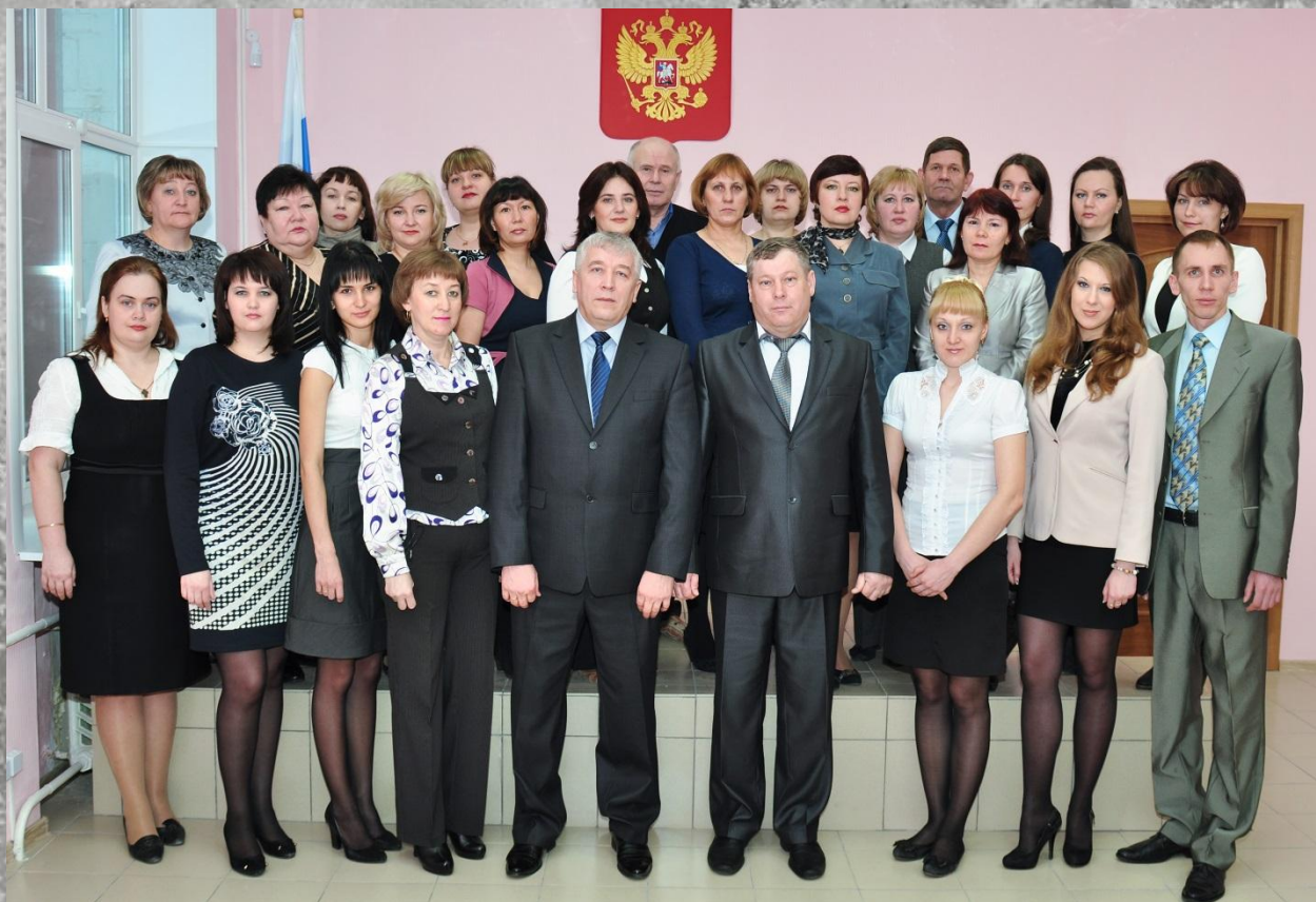
Коллектив Мелекесского районного суда 2013 г.