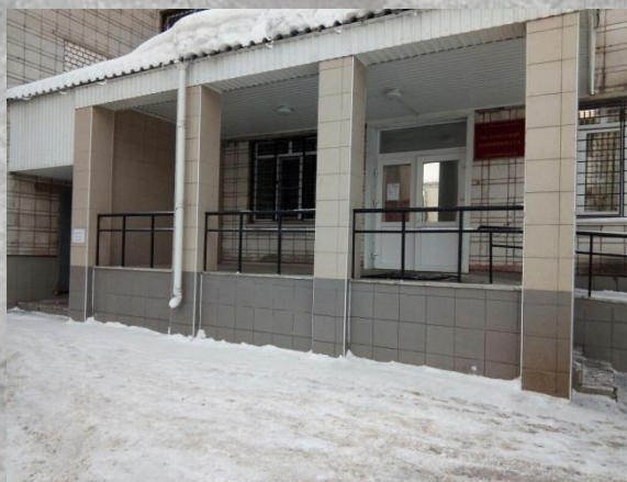
Здание Мелекесского районного суда 2018 г.