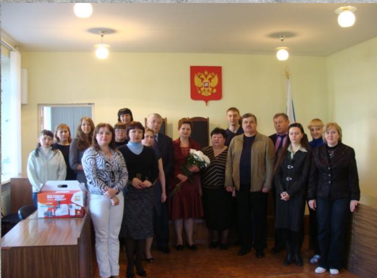
Коллектив Мелекесского районного суда 2012 г.