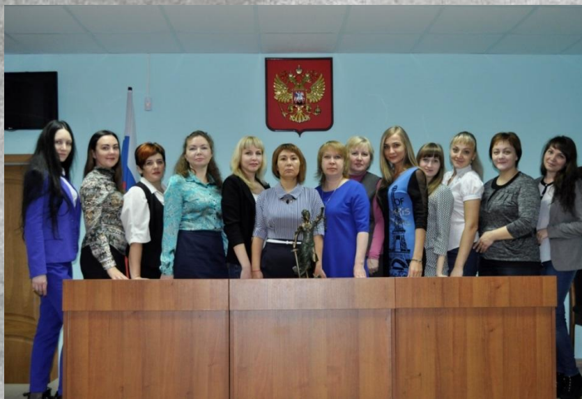
аппарат Мелекесского районного суда (г. Димитровград) 2017 г.