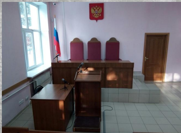
Зал судебного заседания №3 (3 этаж) 2018 г.