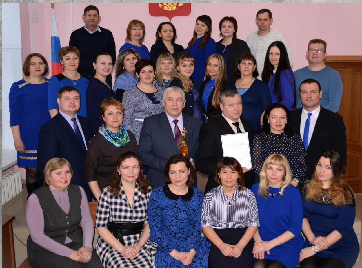
Коллектив Мелекесского районного суда 2017 г.