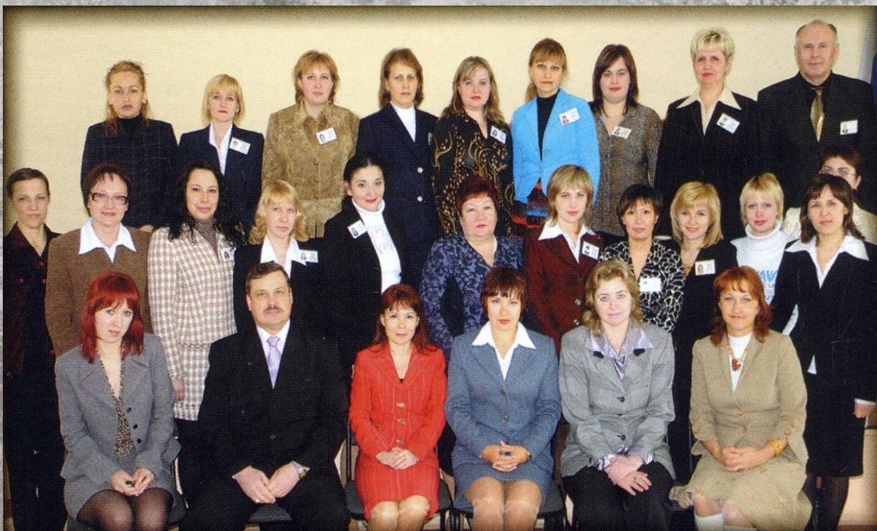
Коллектив Мелекесского районного суда и судебных участков Мелекесского района 2008 г.