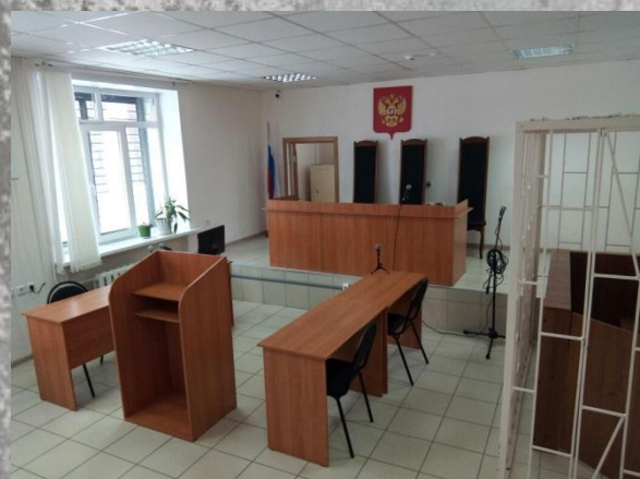
Зал судебного заседания №2 (1 этаж) 2018 г.