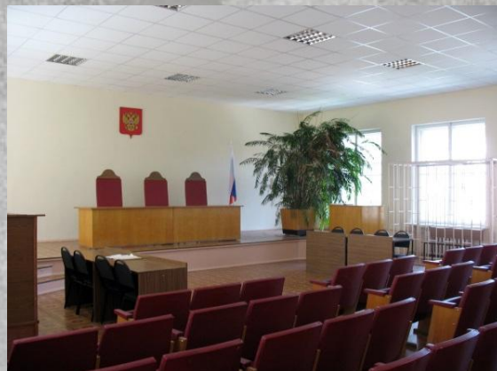
Здание и зал судебного заседания (3 этаж) Мелекесского районного суда 2011 г.