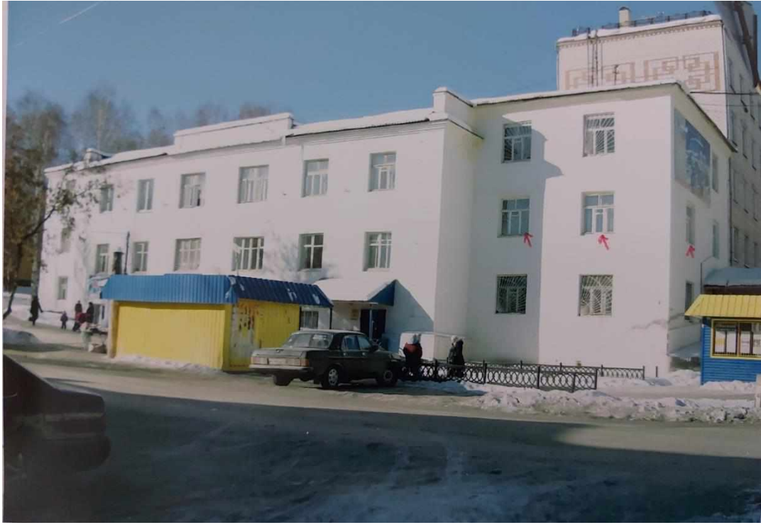
Здание горисполкома по адресу город Куса, ул. Ленина, 8

С 1976 года Кусинский районный суд занимает один этаж из трех в жилом доме №20 по ул. Советская. Это здание бывшего парткома, которое расположено в центре города.