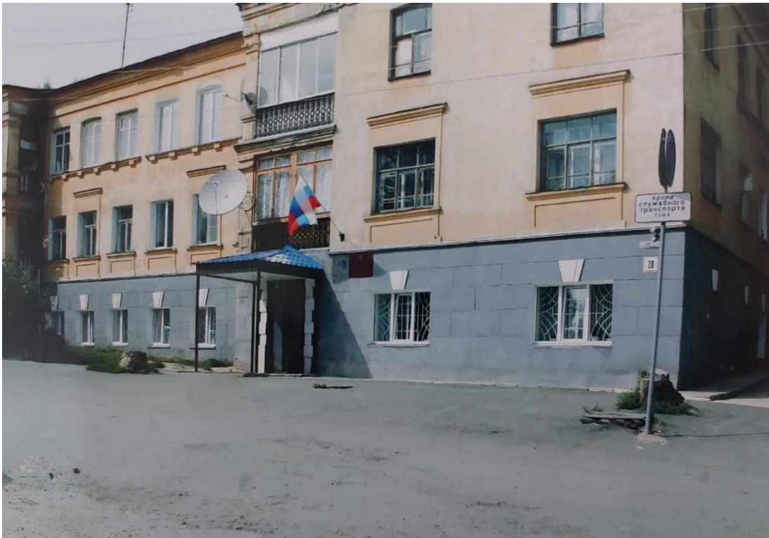
Здание, в котором с 1976 года размещается Кусинский районный суд

С 1976 года Кусинский районный суд занимает один этаж из трех в жилом доме №20 по ул. Советская. Это здание бывшего парткома, которое расположено в центре города.