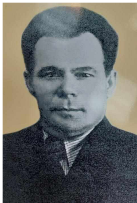
Приказ № 34 от 11 апреля 1940 года