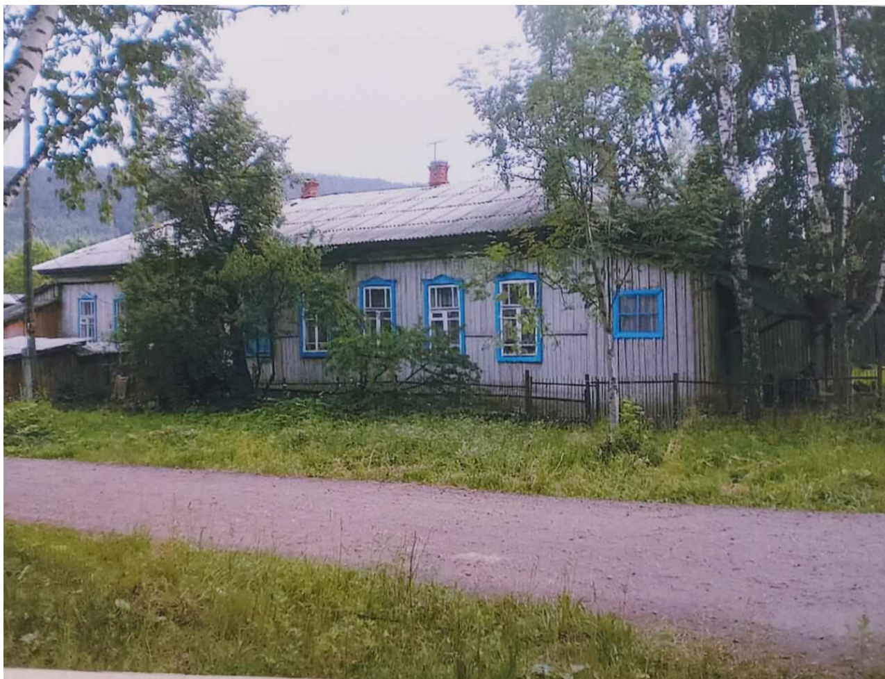
г. Куса ул. М. Бубнова, 2, где Кусинский районный суд просуществовал ровно двадцать лет

Вначале суд находился в бывшем здании горисполкома по адресу город Куса, ул. Ленина, 8. В 1956 году он переехал в самый обычный дом с печным отоплением по ул. М. Бубнова, 2, где просуществовал ровно двадцать лет. В те времена на балансе суда для проведения выездных судебных заседаний имелась даже лошадь по кличке Ванька, сено для которой заготавливали работники суда во главе с судьей.